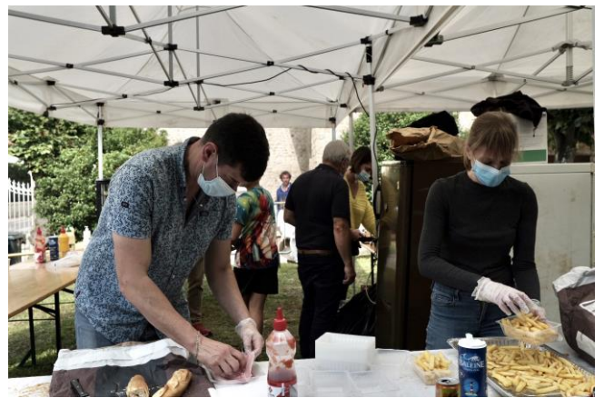
90 kilos de frites ont été préparés !!