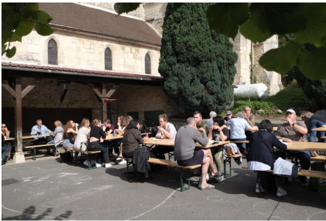
Un point de rendez-vous convivial

40 exposants répartis sur plus de 150 mètres linéaires. Beaucoup de monde toute la journée et des exposants satisfaits